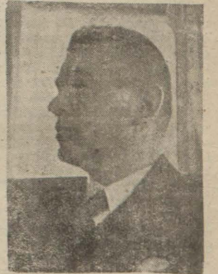
Dr. Behçet Uz'un neşredilmemiş bir resmi