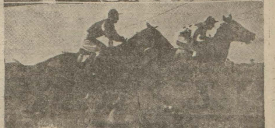
Yarışlardan bir görünüş ve koşuları takib edenler (Yazısı 4 üncü sayfanın 1 inci yüzündedir)