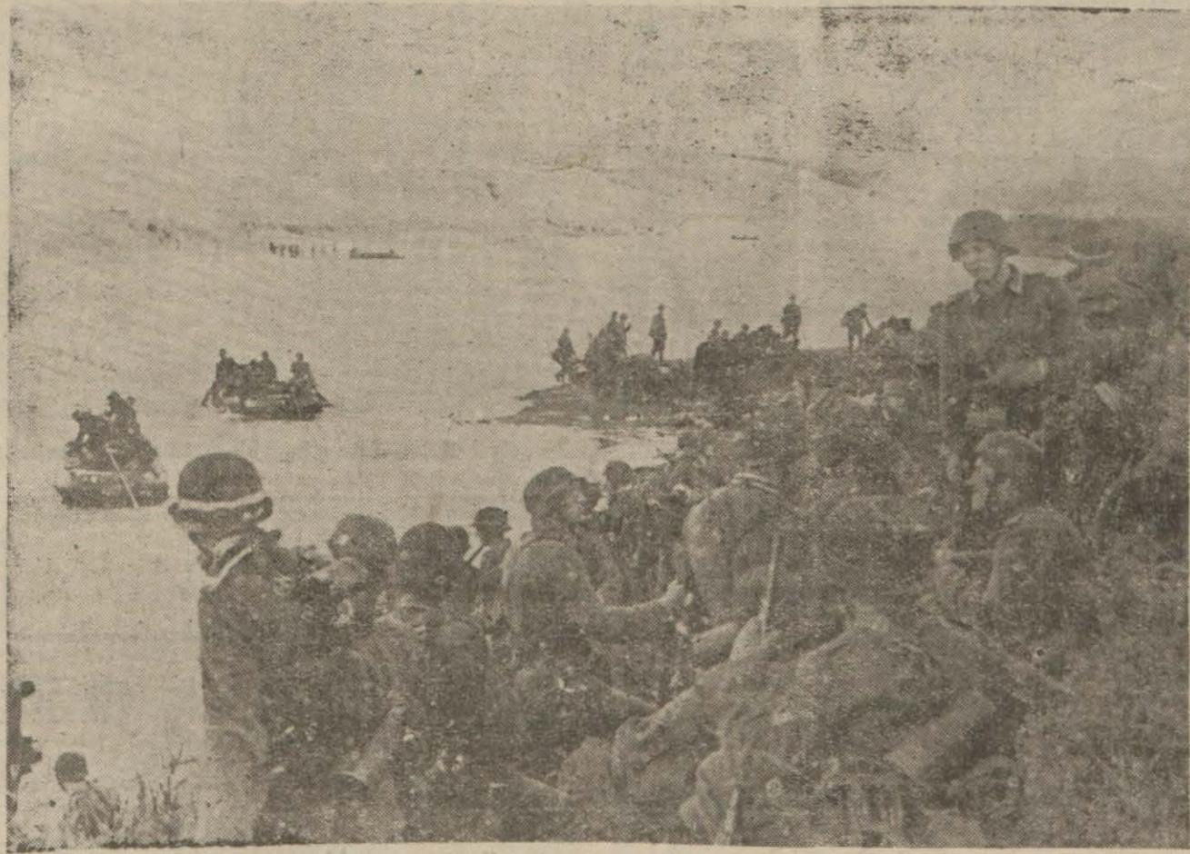
Sark cephesinde Almanlar bir nehri geçerlerken

Dün kana cephesinin bütün kesiminde, simidleri satan ve alanlar görülmektedir.